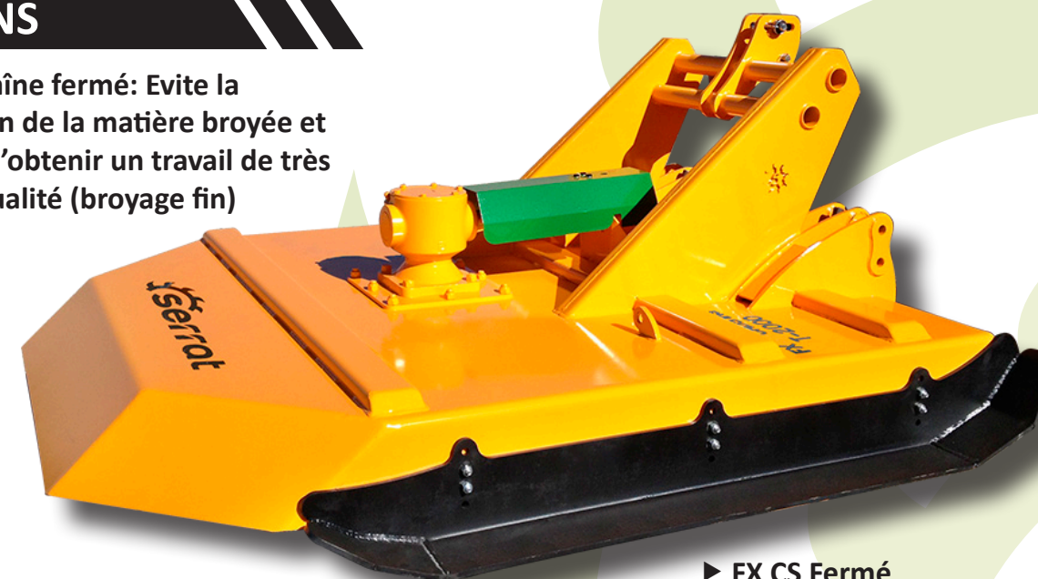
▶ FX CS Fermé