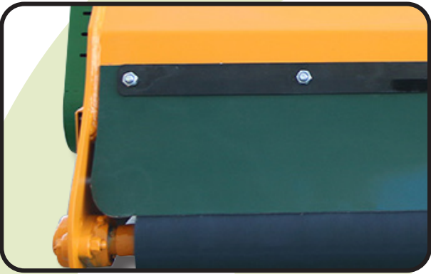
▶ Bavette arrière