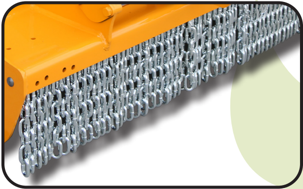
▶ Chaînes avant