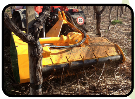
▶ Position avant ou arrière