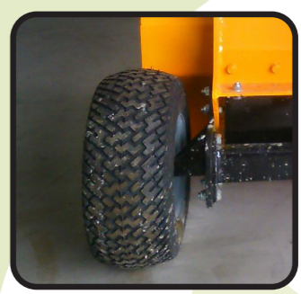
▶ Roues arrière fixes