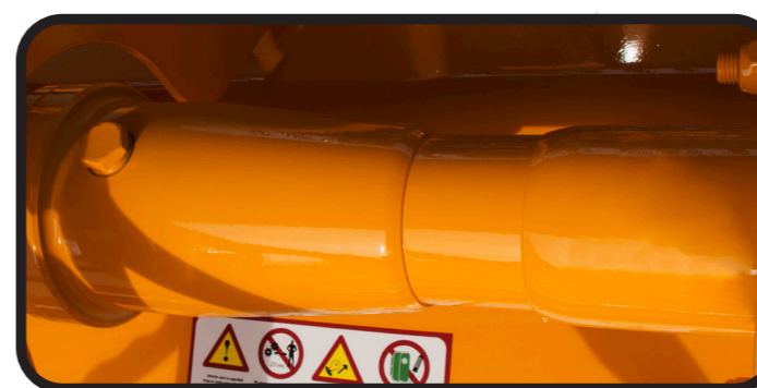
▶ Roue libre entre boîtier/arbre