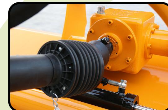
▶ Roue libre sur cardan